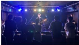
↑ベストアクトの1年生！ ←なんの瞬間？