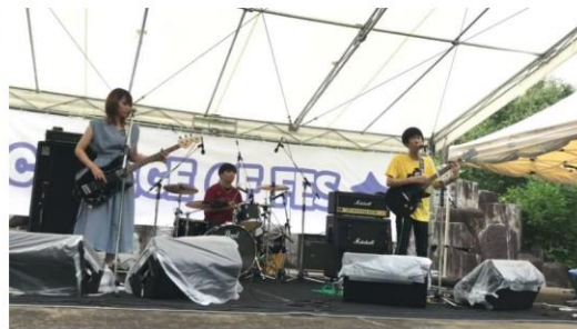
熱いステージ。ほっふわっと→

県内の大学生バンドが大集合！ 3年ぶりに石神の丘での有観客 開催となりました！ 岩大軽音からも多くのオリジナ ルバンド・コピーバンドが出演し ました！！